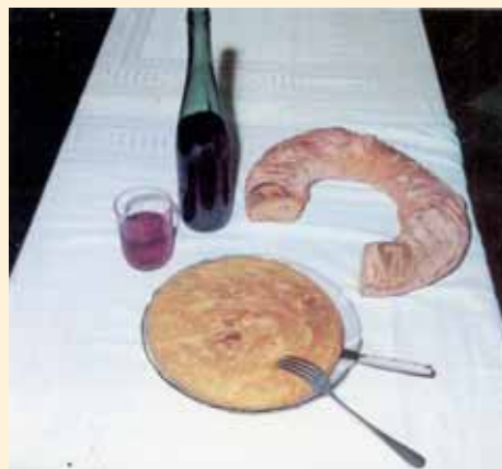
Tortilla de "La Casilla", bola de pan y vino de Betanzos. Foto Everest, de la Guía de Betanzos de los Caballeros y sus Mariñas de nuestra autoría.

Al igual que organizar visitas, mediante la formación de un itinerario específico, en las que se ilustrara sobre su historia, el barrio donde se hallan establecidos y sus características, algo así como FORNOTOUR , y con degustación de sus exquisiteces para reponer fuerzas durante el recorrido. Aunque teniendo en cuenta que se trataría de una divulgación de transcendencia general, también podría denominarse VENDEFORNOS , sin cabida para agencia inmobiliaria alguna, o sino VAIDEFORNOS o quizás VEÑA-DEFORNOS , o cualquier otro reclamo atractivo a inquirir. En fin, una ruta a compaginar con la de los molinos, de tanta significación e importancia para la ciudad de Betanzos, situados en paisajes incomparables de nuestros valles y riberas de los ríos, y que completaría el ciclo de la fábrica y elaboración del pan de Betanzos, de son y fama allende nuestras fronteras.