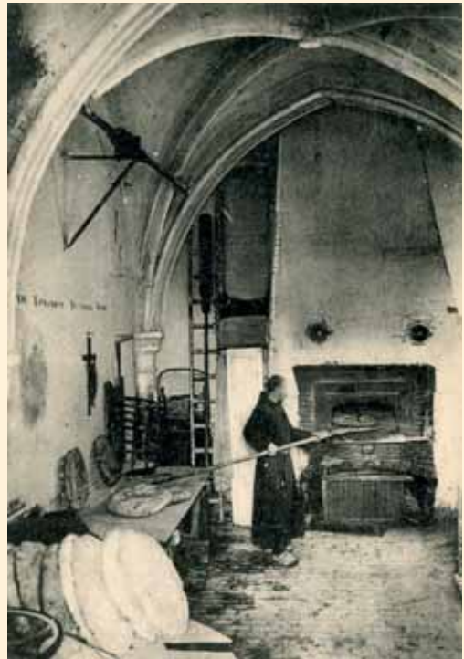
Un trapense horneando en el monasterio.

«... la mitad enteramente de una casa y mitad de un horno y mitad de un lagar que el tenia en el barrio del campo de la feria de la dha ciudad el qual hesta de mistidunbre con el sobredicho...a condicion quel dho Pedro de bilar le a de cocer y dar cocido a su costa y min-sion todo el pan mixto y trigo y enpanadas quel dicho Regidor tubiese menester para el gasto de su casa y su granero, con mas le a de dar y pagar todos los dias de labor de los dichos seis anos ocho maravedis de pan trigo que son dos panecillos de a quatro maravedis cada uno el qual el dho Regidor a de mandar a buscar cada dia y estos dhos dos panecillos de a quarto le a de pagar siempre segun ba declarado cociendo o no cociendo el dicho horno. Por manera que si dejare de cocer a de ser por cuenta del sobre dho