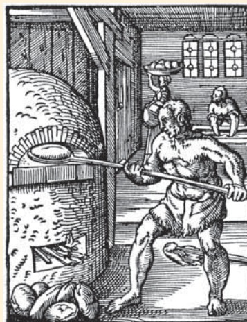
Panadero del libro de las profesiones, por Jost Amman (1568).