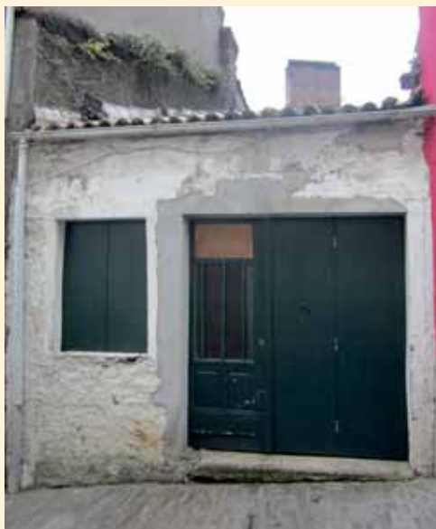
La Casa de la Leña del horno de Santa María, en la Calle de los Clérigos.