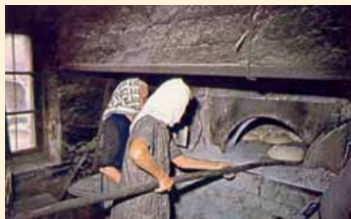
Horneras de Toulouse por H. Marcou. (Archivo del autor)

Una vez superadas las citadas escaleras, se encuentra inactivo o forno do Rocha, en la Calle de la Puerta del Hórreo, antigua Travesía de la Cortaduría o Primera Travesía de la Torre nº 5, con su huerto posterior sostenido por la muralla de la Rúa Nueva, que también recordamos en funcionamiento, aunque en la actualidad se halla en desuso y relativo buen estado.