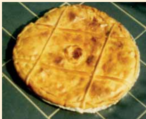
Empanada de Betanzos. 1986.

De no mantener su destino originario, podría ser un proyecto de futuro el aprovechamiento de nuestros antiguos hornos o tahnas como tabernas típicas del país, cual FORNADEGAS , con sus tradicionales y originales denominaciones, en las que se ofrecieran todo tipo de vinos, se pudiesen degustar los exquisitos manjares « enformados », sin faltar las sabrosas empanadas de Betanzos (sin grammar) y demás gastronomía mariñana, para almorzar o cenar