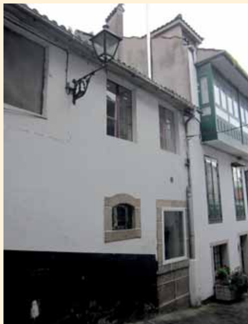
Fachada del horno de Santa María, construido en el siglo XVII en la antigua Rúa do Forno.

Por lo tanto, el horno contratado lo habrían de «azer todo de Cantaria buena y nueva» y lo tendrían que finalizar en el mes de mayo del siguiente año 1618. Sería fabricado en forma de círculo con dos «sequeiros en donde se seque el pan», con la correspondiente escalera de cantería al igual que la bóveda, cuya primera hilada ha de ser de piedra de media vara de largo, la segunda de tres cuartas y las restantes de una vara; en cuanto a las «anteiras» o jambas de la boca del horno y el dintel han de tener una cuarta de grueso, entre otras condiciones (Vid. Apéndice IV), y que llegarían a nuestros días con unas dimensiones de 58 ctms., de alto por 80 de ancho. Las medidas del circular recinto son de cuatro metros de largo y otros tantos de ancho, y de noventa y cinco centímetros de la solera a la cumbre de la bóveda.