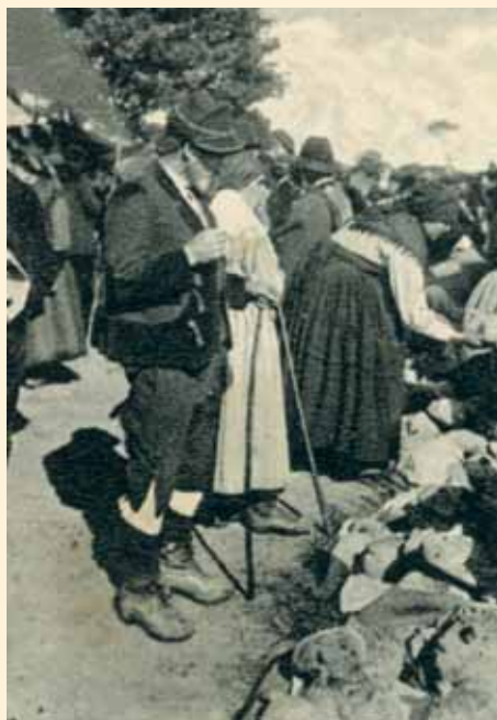
Mercado pan en una feria a principios del siglo XX. Album de las Bellezas de Galicia, dirigido por Gil Cañellas.

Asimismo nos acordamos de la cartilla de racionamiento impuesta tras la fratricida y vergonzosa guerra civil, con la que era preciso concurrir al horno por la correspondiente ración de pan, una época triste en la que también existieron sinvergüenzas y aprovechados a cuenta de quienes pasaban hambre y necesidades. Sería implantada por Orden Ministerial del 14 de mayo de 1939, para regular el consumo de artículos de primera necesidad, dando origen al estraperlo mediante la venta ilegal en el conocido «mercado negro» , y que permanecería vigente hasta 1952.