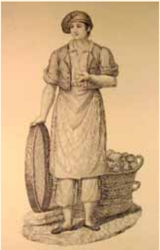
Panadero madrileño del s. XIX