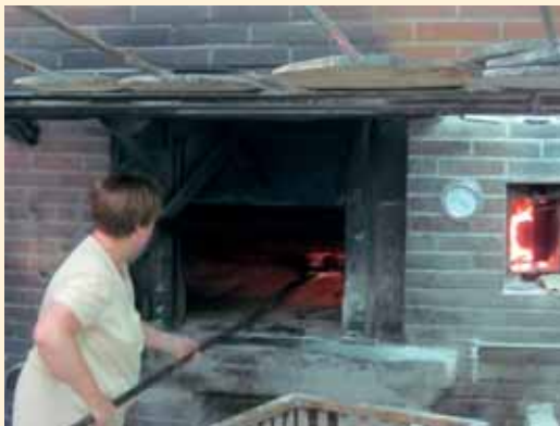
Horno del Rabizas en la actualidad.