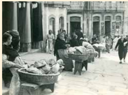
Puestos de pan de mollete en la Calle de la Plaza, en los años cuarenta del pasado siglo. Estereoscopia Ed. Relley.