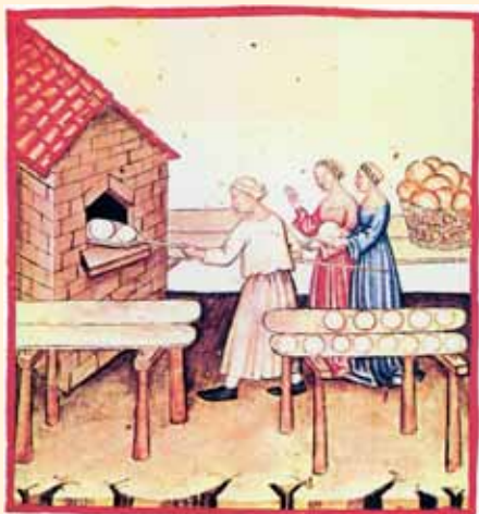
Horno de pan "Panis opus", del Theatrum Sanitatis.