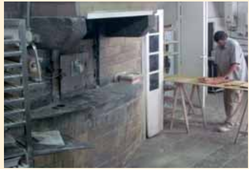
El horno de Santa María en la actualidad.