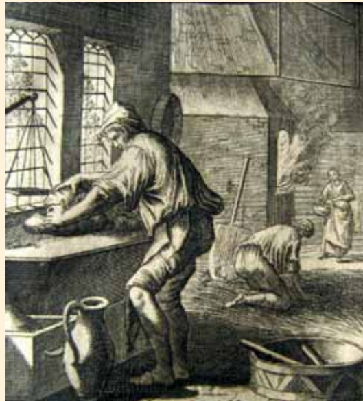
El panadero. Grabado por Christoph Weigel en 1698.