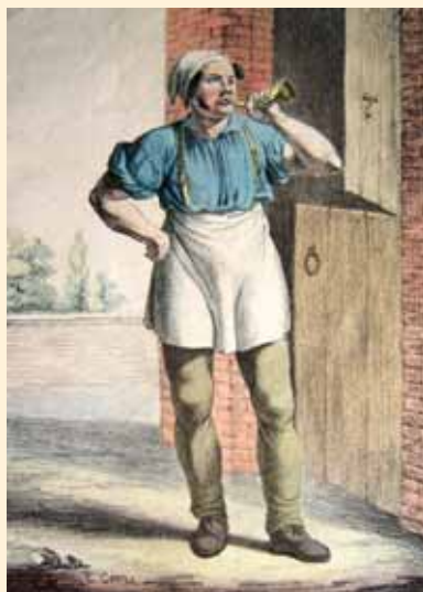
Panadero belga anunciando la venta de pan en el siglo XIX.