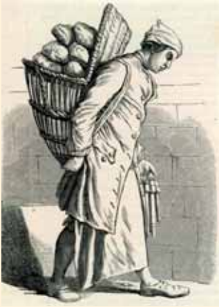
Panadero francés batiendo las tablillas, para la venta de pan en el siglo XVIII. (Grabado de época de la colección del autor).