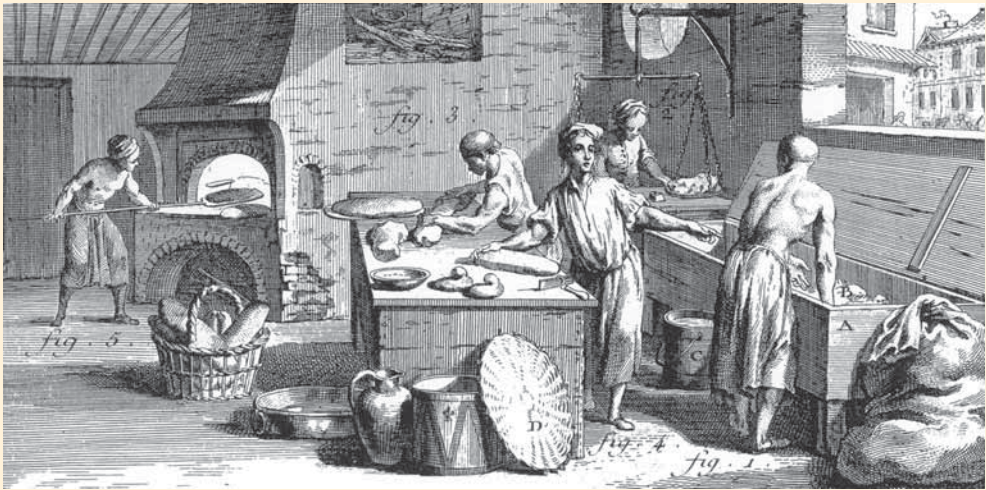
Un horno de pan en el siglo XVIII. A Diderot Pictorial Encyclopedia of Trades an Industry.

«...y da en este dho arrendamiento la mitad enteramente del orno que sealla en el Campo de la Feria desta Ciud segun esta misto Con la otra mitad que es de dho Villaverde como Marido de su mug r Y sus Consortes segun es bien conozido y de foro de la Cofradia de animas y Don Alonso de Camba a quien se paga cada un año cierta pensión...p r tiempo y espacio de seys años ... y en cada uno a de pagar dho Domingo devillaverde y sus erderos la penson que al otorgante Corresponde...y asimesmo lea de Coçer el pan que necesitare p a su casa como tambien los paneçillos que quisiere cocer todos los dias...no lo firma on por no saver a su rruego lo yzo un testigo de los presentes que lo fue on Dom o Ss ez Vilariño Pedro da edreira y Ju o da rroca fig a V o desta Ciu d e yo s no que dello doi fee y de q e conosco a los otorg te ... [Firmado]. Como testigo y a ruego Juan da Roca Figueroa. [Rúbrica]. Ante mi. [Firmado]. Juan Sanchez Merelas y Fandiño. [Rúbrica]» 31 .