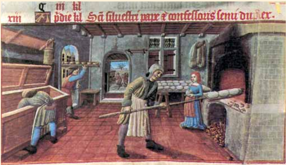
Panadería del siglo XV. Biblioteca Nacional, París.