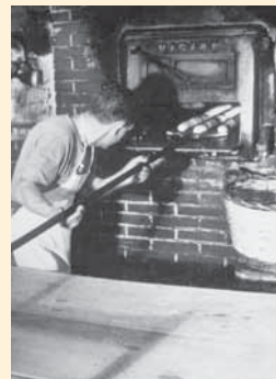
Panadero introduciendo pan en el horno.