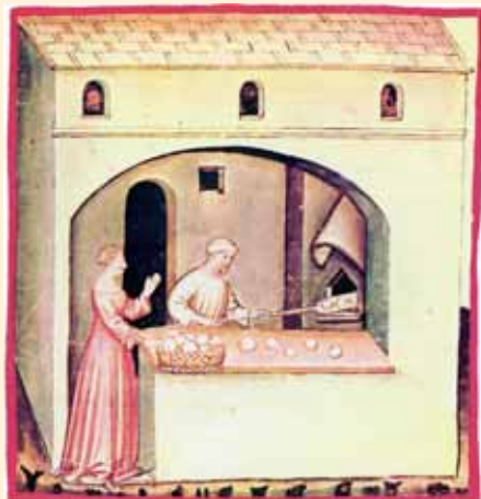
Horno de pan del Theatrum Sanitatis.

Que sería lo más liviano de sus fechorías, y no se imaginen lo acontecido durante los ciento sesenta y tres días de ocupación francesa, que dejarían al pueblo vilipendiado y sin nada que llevarse a la boca, ni siquiera una ración de pan de hogaza.