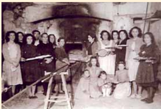
Grupo de vecinas de Torreblanca (Castellón) reunidas en la panadería para cocer los "Rollos de San Antonio".

La primera noticia que hemos localizado sobre su reconstrucción pertenece al primer tercio del siglo XVII. En la feligresía de San Martín de Brabío, el 13 de junio de 1633, el cantero Gregorio Calviño vecino de Betanzos, otorgaba carta de pago al licenciado Rodrigo Colmelo Bermúdez, como mayordomo de la Cofradía de Nuestra Señora de la Concepción: