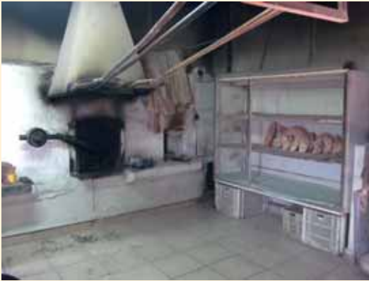
La Panadería Moar en la actualidad.