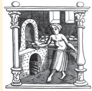
Representación de horneras y panaderos en antiguos grabados.

Recordamos nueve en funcionamiento a mediados del pasado siglo, distribuidos por la ciudad y extramuros 3 , aunque algunos no llegarían al presente. La mencionada variación estaba directamente condicionada por los tiempos de guerra, epidemias, hambrunas, escasez de frutos a causa de las malas cosechas por climatología adversa, e incluso por falta de leña, como veremos.