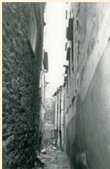
Callejón del Horno del Caño de la Fuente de Unta, al fondo y mano derecha se encontraba el horno, antes de ser clausurado. (Foto Fersal, 1987).

Entre otras condiciones, se obligaba a mantener el horno en buen estado y bien aderezado, y también a darle un brasero todos los días durante los seis años del arriendo.