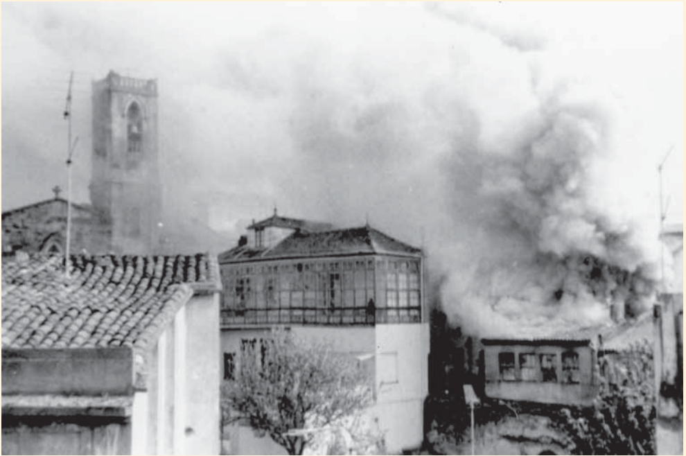
Incendio del horno de Villaverde, en la Calle de San Francisco, acaecido en los años setenta del pasado siglo, visto desde la fachada posterior.