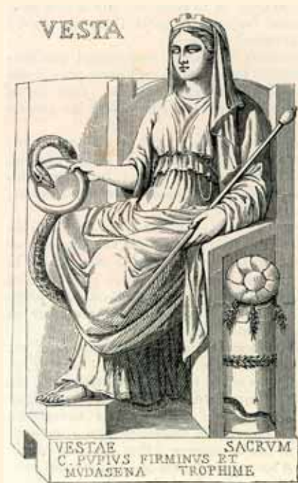
Vesta, la diosa de los panaderos. Grabado del s. XVIII.

del Horno, que también sería conocida como de los Sombrereros, al principio de la Calle de la Rúa Nueva, y la Rúa do Forno que es la misma Calle Segunda de los Clérigos, donde se encuentra establecido el horno de Santa María, así conocido por su inmediatez con la iglesia parroquial de Santa María del Azogue, al igual que se contempla a lo largo y ancho de la geografía hispana.