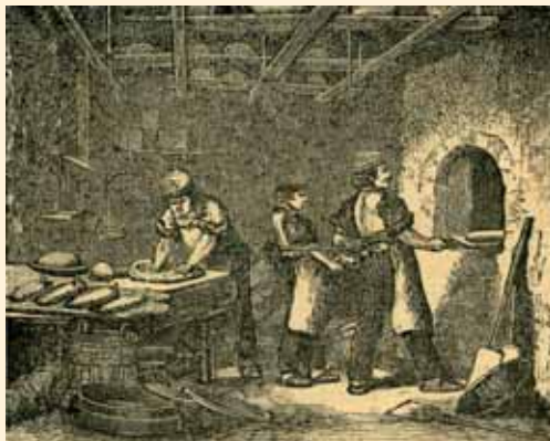
Grabado de un horno del siglo XIX, de la obra Artes y Oficios.

«...La mi casa sita en la pescaderia desta çiudad en la calle derriva, nueva, questa çerrada de paredad (sic) debaxo Arriva asta el tejado por la trasera y delado que parte y se demarca por el andamio del