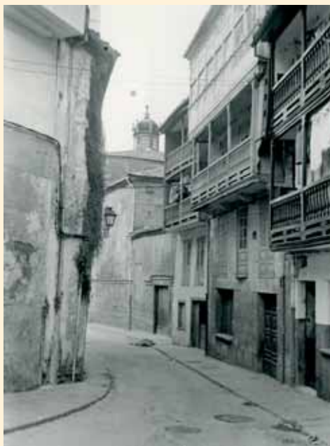
El horno de la Fuente de Unta, casa de piedra de la derecha.