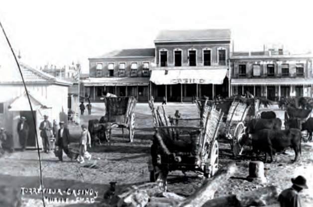
Años veinte del pasado siglo. Vista del Casino desde el muelle.

Pero la sal, antes de origen marino, no es el único producto que Torre Vieja ha extraído u obtiene del mar. También la pesca es una actividad lucrativa para las pocas familias que se dedican a ella. Del Mediterráneo sacan, los restaurantes de la ciudad, los elementos básicos de los platos típicos. Además el mar proporciona salud y bienestar, gracias a las propiedades terapéuticas del agua, recomendada contra las enfermedades cardíacas, reumáticas y respiratorias.