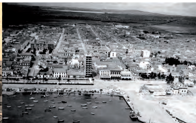
Año 1914. Plaza de la Constitución e iglesia.