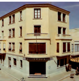
Oficina de la Caja de Monserrate en 1956