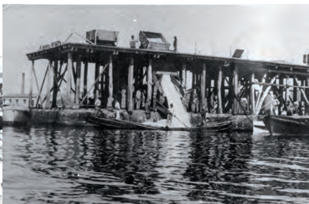
Principios del siglo XX. Carga de barcaza en las Eras de la Sal.