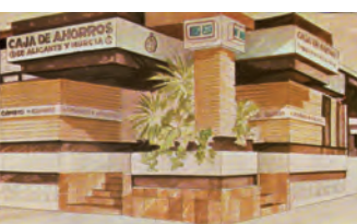
Diseño exterior de la sucursal de la CAAM tras la fusión de 1976, atribuido al aparejador Ángel Fernández.