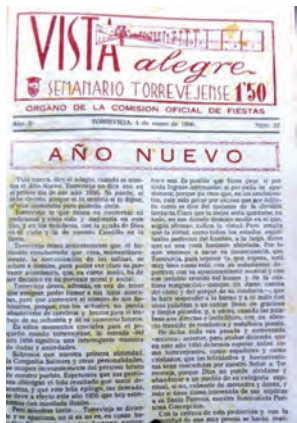
Periódico torrevejense. 1 de enero de 1956.

Gracias al colega Paco Cascales, y a sus gestiones, consigo algunas fotos de época de Torrevieja, y la fachada de aquella primera