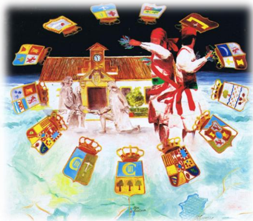
Portada de las Actas del VI Congreso Histórico sobre Nuevas Poblaciones La Carlota, Fuente Palmera y San Sebastián de los Ballesteros. Mayo 1994