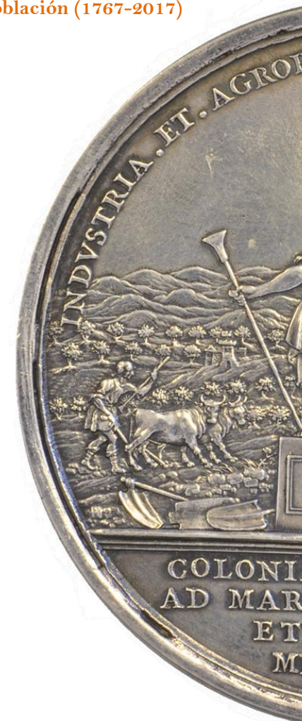
Moneda Conmemorativa de la fundación de las Nuevas Poblaciones por Carlos III Acuñada en 1774 en F.N.M.T. Grabadores: Tomás Francisco Prieto y Gerónimo Antonio Gil Museo de La Carolina

Los objetivos de este encuentro serán los de profundizar en el fenómeno de las colonizaciones agrarias en la Europa del siglo XVIII, con especial atención a las Nuevas Poblaciones de Sierra Morena y Andalucía; analizar las disposiciones normativas que les dieron origen; estudiar los movimientos migratorios de colonización, tanto a nivel interno en cada país como de carácter internacional; conocer la praxis de estas iniciativas a través del devenir de sus protagonistas; ahondar en el urbanismo colonial, la ocupación del territorio y las manifestaciones artísticas; abordar el papel de la mujer y la unidad familiar en la sociedad colonial; el impacto y repercusión que despertaron en los estamentos y la sociedad en general; así como la trascendencia política, social y cultural del fenómeno colonizador.