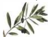
CPR de Almendralejo