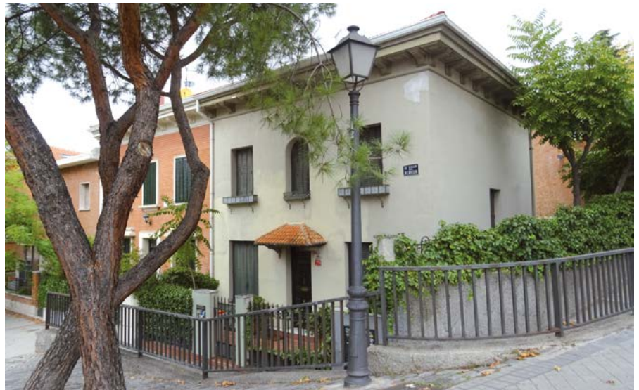
Vivienda tipo en el Barrio del Viso.