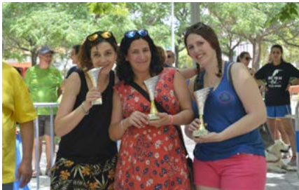
Las mejores lanzadoras de hueso de aceituna.