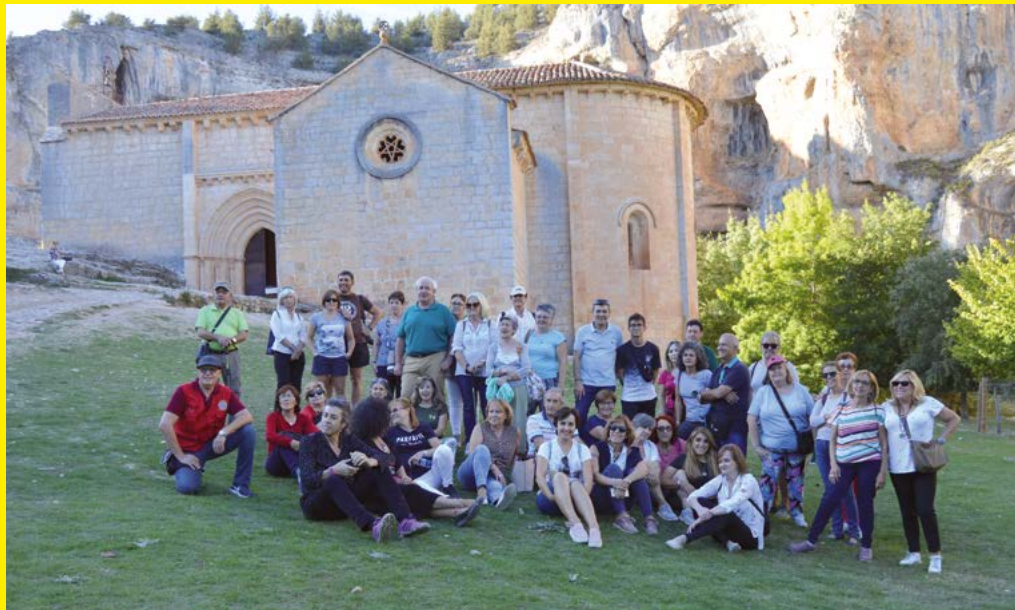
Cañon del rio Lobos (Soria).

Todas nuestras visitas culturales de 2019