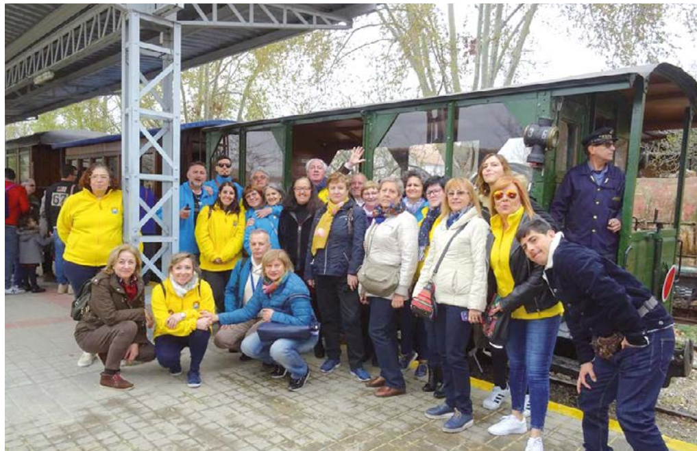
Un día inolvidable en el Tren de Arganda, que pita más que anda.

A nuestra llegada a la estación, nos encontramos con numeroso público que se agolpaba en el andén, entre los que se encontraban nues-