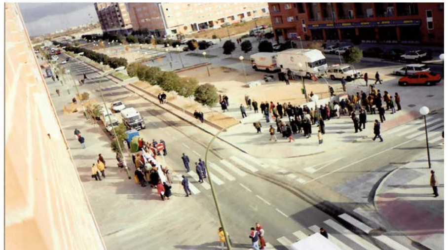
Inauguración del tramo de la línea 9 en la boca del metro del barrio, el día 1 de diciembre de 1998.