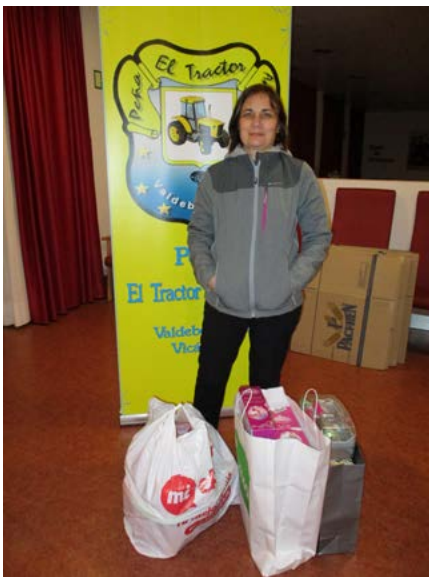
Bolsas llenas de juguetes, esta es la generosidad de barrio nuestro barrio.

Os esperamos del 10 al 20 de este mes en AMAVIR Valdebernardo para seguir repartiendo un año más miles de sonrisas.