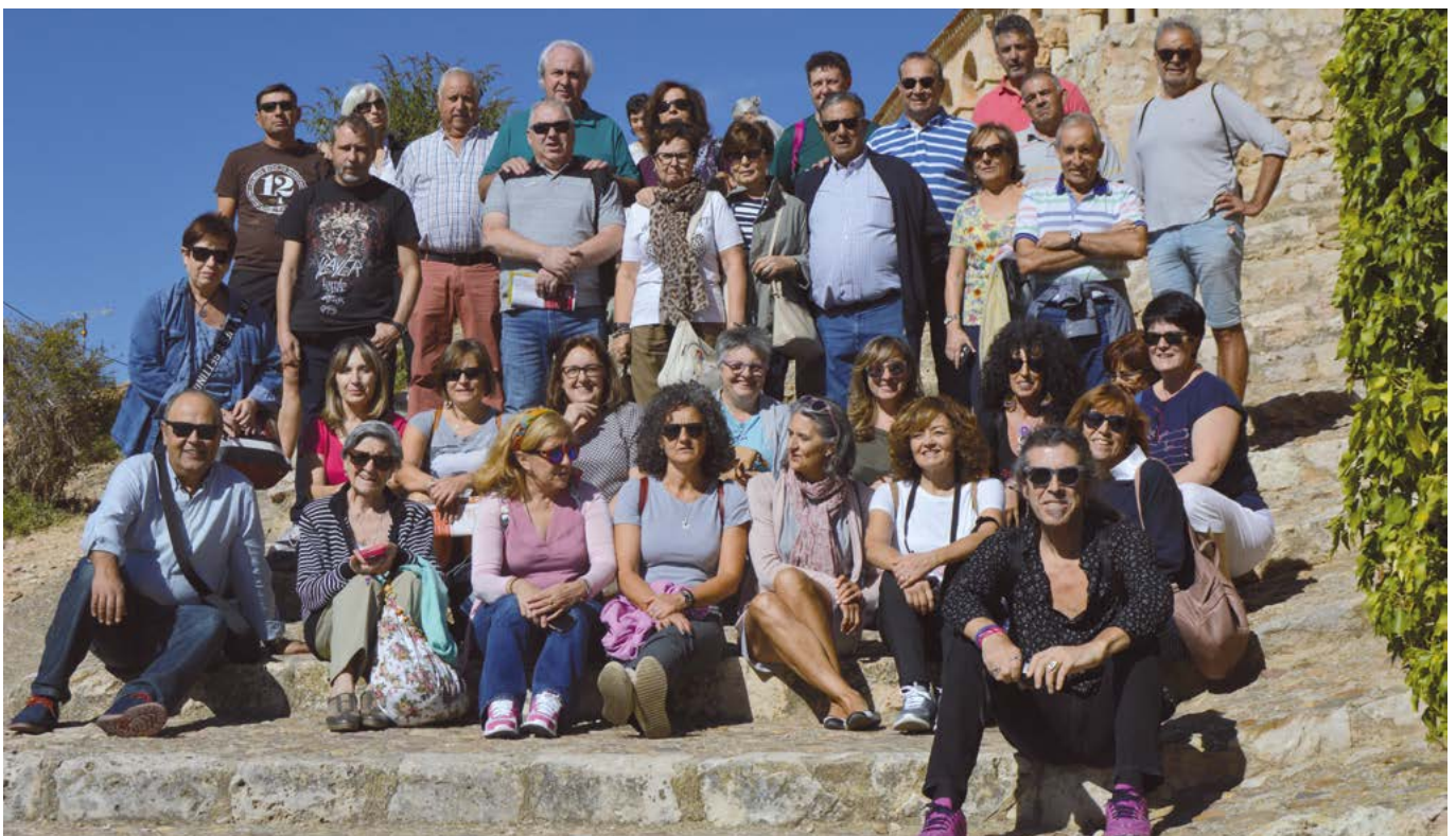
Aprovechamos la escalinata de la iglesia de Nuestra Señora del Rivero, para hacernos la foto de grupo.