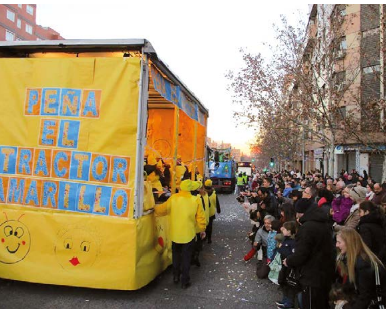
En la calle Mineva nos esperaba un gran número de vecinos.

Otro año más y ya estamos preparando la próxima.