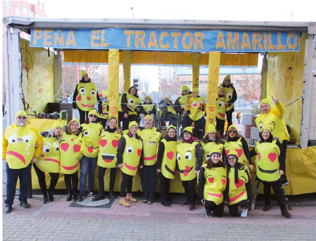
Nuestra tropa al completo.

¡Más emoticonos!, dicen los pequeños. Parece que les han gustado nuestros disfraces y la carroza.