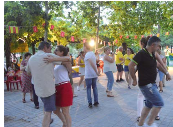
Fin de fiesta.