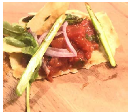
Trasgu “Tartasgu de Tomate”.