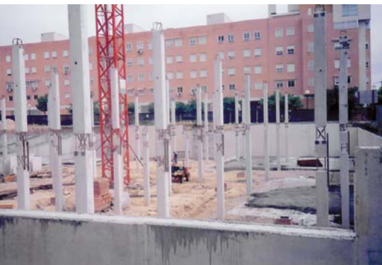
Centro de salud en construcción, marzo del año 2000.