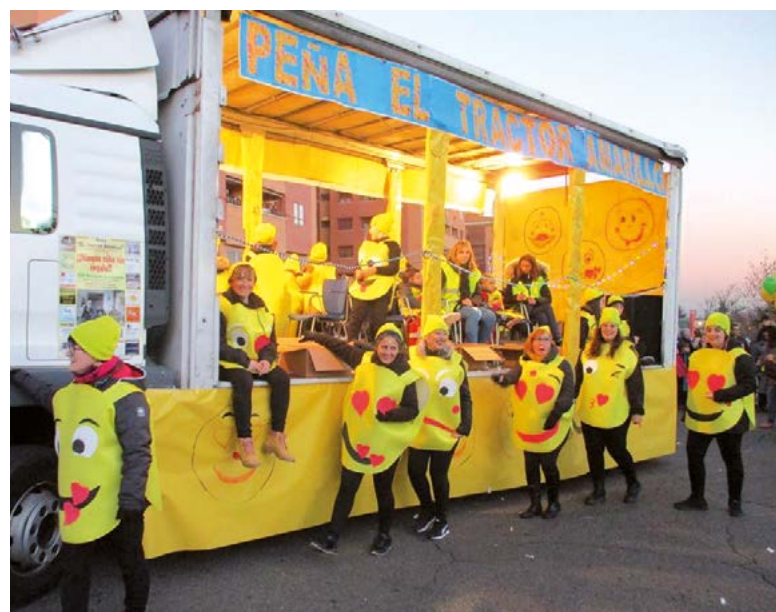
La seguridad de nuestra carroza no está reñida con el buen ambiente.