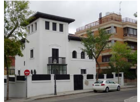
Hotelito de la colonia de La Prensa y Bellas Artes

Un fin de semana muy bien aprovechado como podéis comprobar.