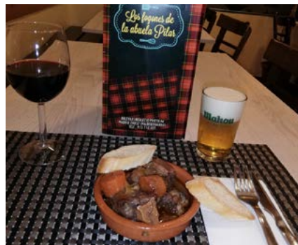
Los fogones de la Abuela Pilar, con su cazuelita de rabo.