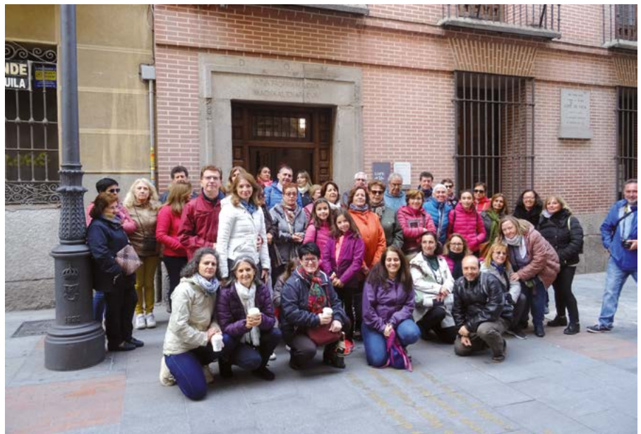
Finalizamos nuestra visita en el barrio de las Letras en la puerta de la Casa-Museo de Lope de Vega.