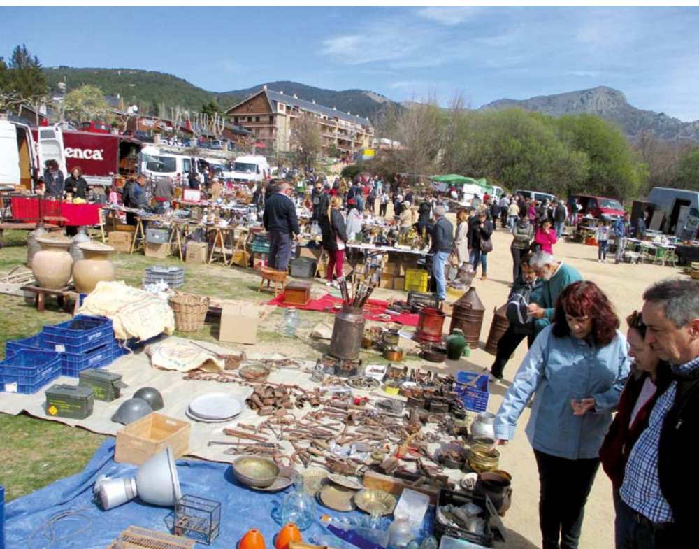
El rastro de antigüedades es una de las atracciones turísticas todos los domingos.

Costó un poco reunir al grupo, pero la propuesta programada por nuestras guías era muy atractiva para perdersela. El rastro de antigüedades se instala cada domingo en la cerca del Moro y es casi de obligada visita. Atrae a mucho público porque se puede encontrar todo tipo de artículos de segunda mano. Desde aquí al autocar para regresar a Vicálvaro y recordar con mucho cariño esta localidad de cuento.