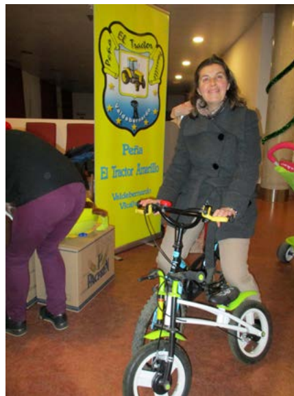
La campaña en ocasiones va sobre ruedas.