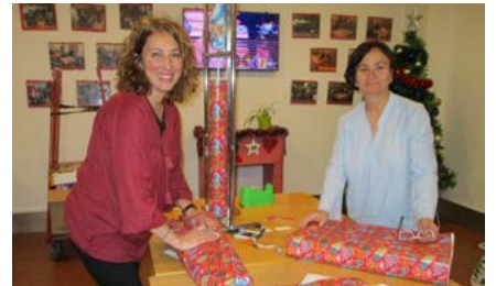
Nuestro mejor patrimonio, nuestras voluntarias