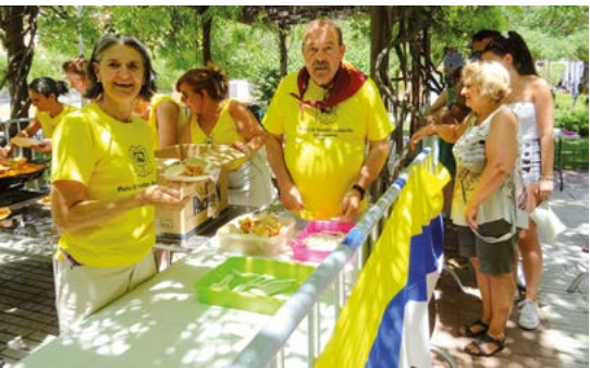
Trabajo de equipo.