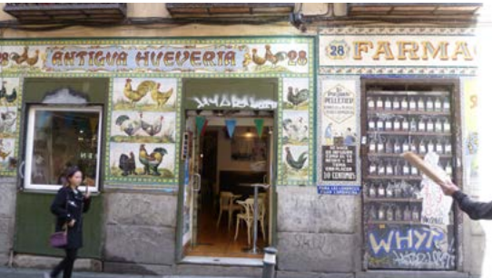
En la calle San Vicente Ferrer, nos encontramos con dos establecimientos decorados con bonitos azulejos de Talavera de E. Guido.