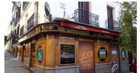
La bodega de Ángel Sierra", 1917 en la calle Gravina, conserva su aspecto fundacional con espejos pintados y madera forrando la fachada.

Tenéis una amplia información de estas dos visitas en nuestra página de facebook con un nutrido reportaje gráfico.