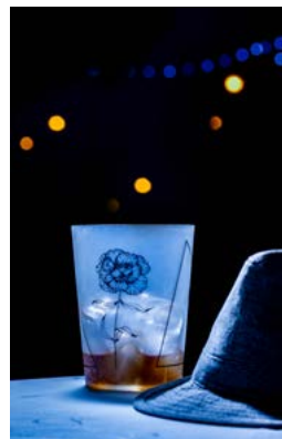
Javier Martín Accessit fotografía vasos reutilizables.