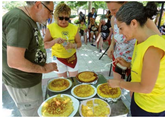
El jurado del concurso de tortilla en plena deliberación.