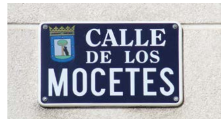
Placa de otra de las familias históricas de Vicálvaro.

El resto de las calles y plazas del barrio fueron elegidas por el Ayuntamiento a propuesta de los diferentes grupos políticos representados en aquel momento.