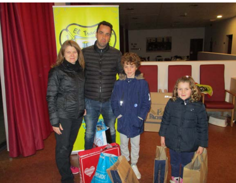
Una familia al completo donando juguetes, regalando sonrisas.