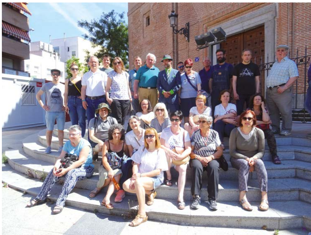
Grupo en la escalinata iglesia de Leganés.

Aquí finalizó nuestra visita y no podemos más que agradecer a nuestros anfitriones el trato recibido y desearles que este proyecto siga adelante gracias a su entusiasmo.