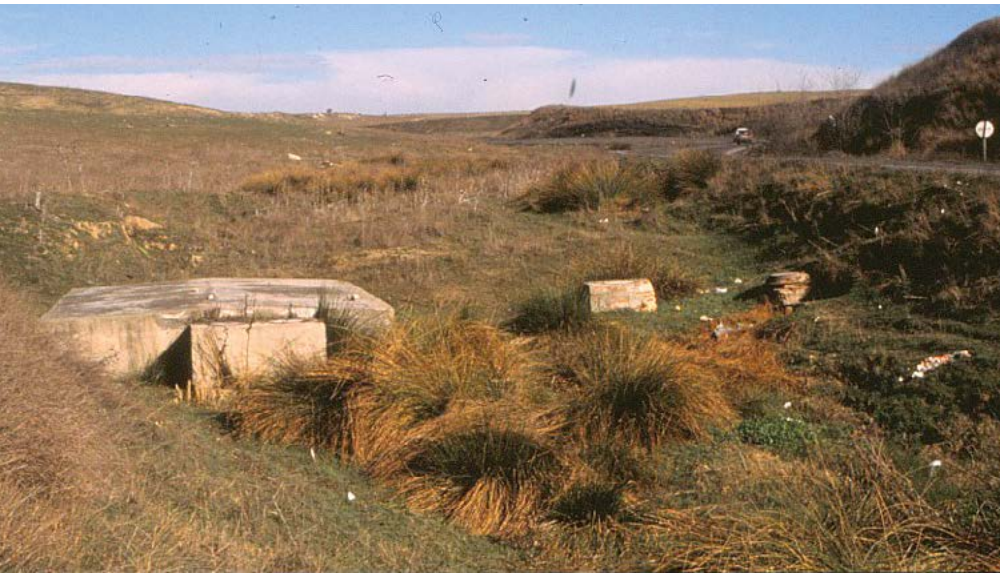
El viaje de la Fuente Carrantona atraviesa todo el barrio y finaliza en Vallecas, a la altura del antiguo CMB, junto a la carretera C-602 donde afloraba el agua.

Y la obra más antigua que surca por estas tierras es la Fuente Carrantona, que se la nombra por primera vez en 1190, y que muchos de sus pozos de conducción de aguas están bajo las parcelas de la urbanización. Fueron realizados en el siglo XV-XVI y servía para llevar el agua a Vallecas. Un ramal alimentaba la Fuente de los Cinco Caños en Vicálvaro.