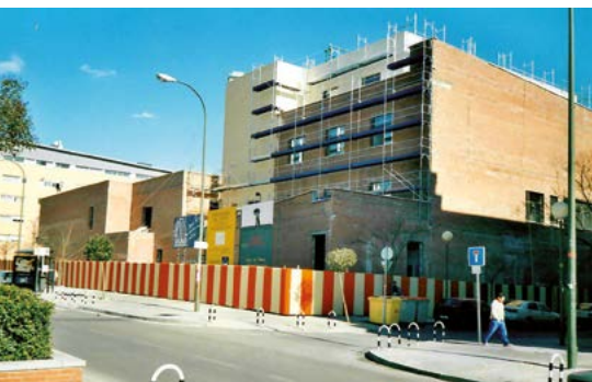
El centro cultural en construcción, diciembre del año 2002.