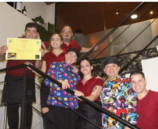
La plantilla de La Gruta al completo celebrando el título.