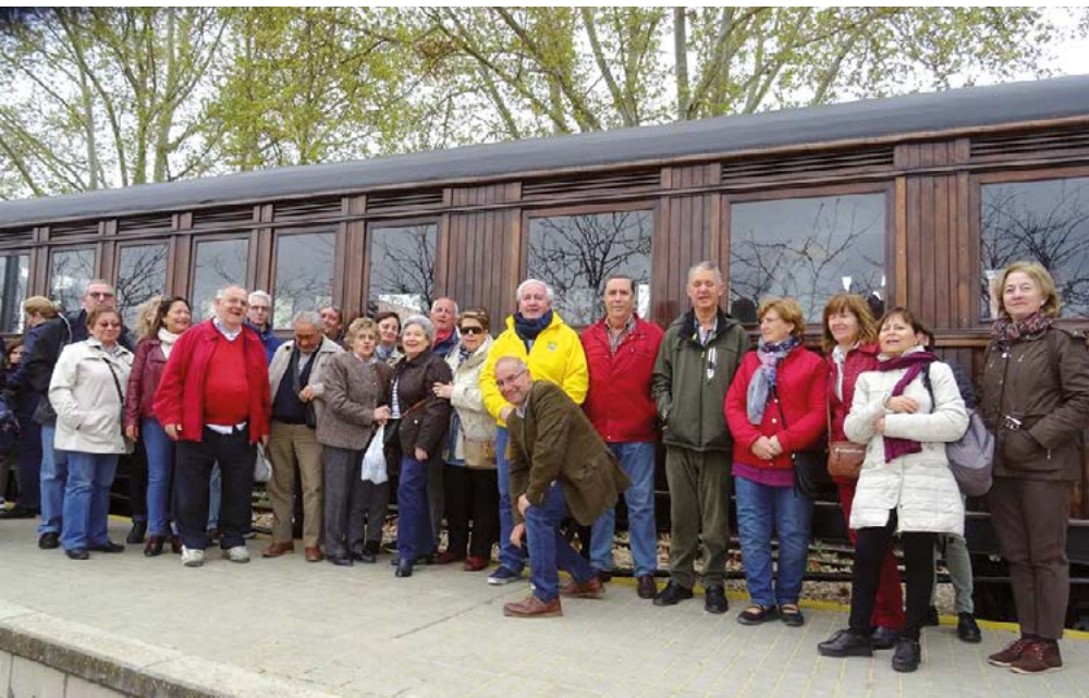
En el apeadero con muchas ganas de subir a este tren histórico.

tros compañeros, expectantes de la entrada del convoy como si se tratara de una película.