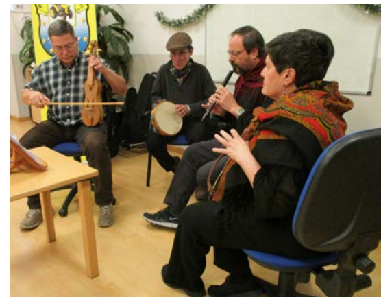
Un momento del concierto de música castellano-leonesa.