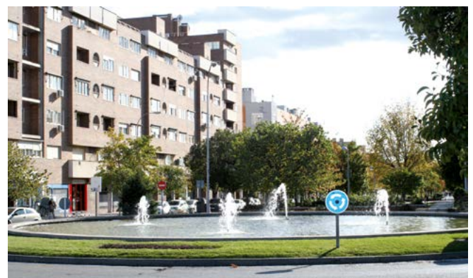
Plaza de los Dávilas dedicada a esta familia histórica de Vicálvaro.