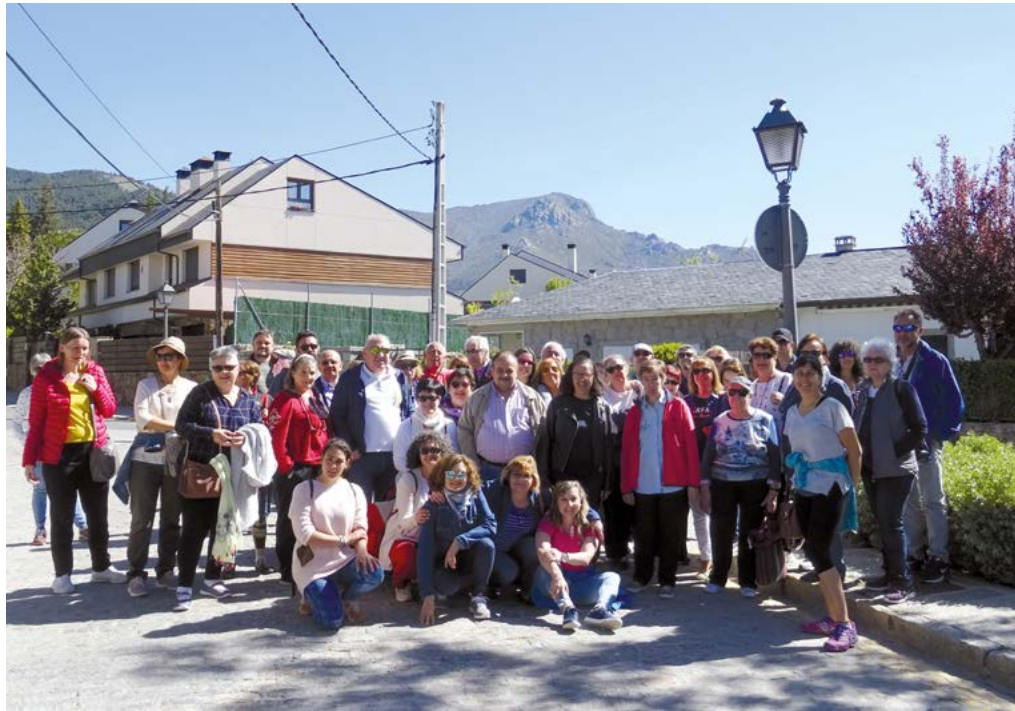
El grupo posando con el pico de la Maliciosa al fondo.

Continuamos nuestra ruta urbana por las calles adoquinadas y estrechas, llenas de vida gracias a los turistas que en gran número se acercan hasta aquí en fin de semana. Camino de la iglesia de la Natividad de Ntra. Sra. de Navacerrada, pudimos