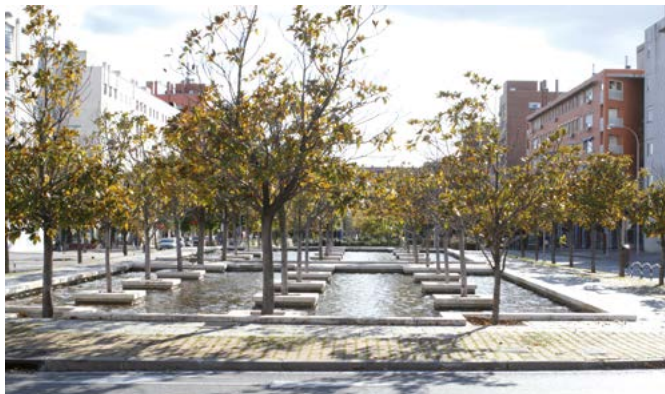
Cruce de los bulevares Indalecio Prieto y José Prat, dedicada a estos dos políticos de la II República.