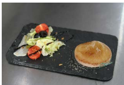
Asador el Bulevar con su “Cucharita de Foie”.

En cuanto a los establecimientos más visitados Los fogones de la Abuela Pilar, tercer clasificado, Asador El Bulevar, en segundo y la Gruta consiguió también este título.