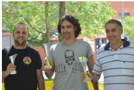
Podio masculino de lanzamiento de huesos de aceituna.