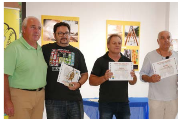
Los cuatro fotógrafos premiados con el presidente.