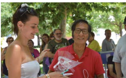
Tuvimos la visita de un inventor que promocionó su recoge cacas entre los participantes del concurso canino.