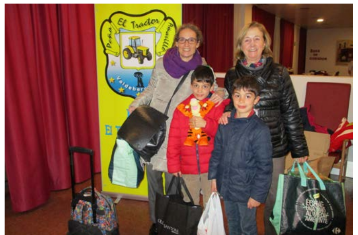
Los más pequeños donan sus juguetes con alegría.