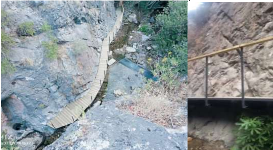
Vista y detalle de la nueva pasarela sobre el río Cuadros (Bedmar) entre el Adelfar y los Nacimientos del Sistillo.