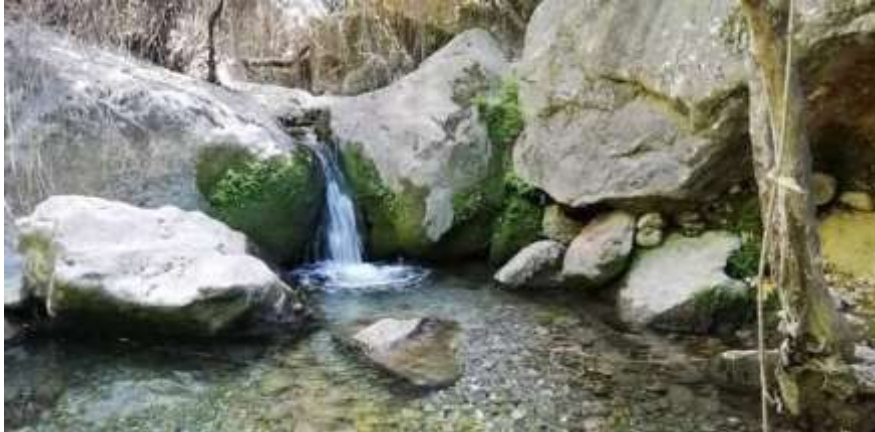
Cauce del Río Cuadros (8/IX/2020).